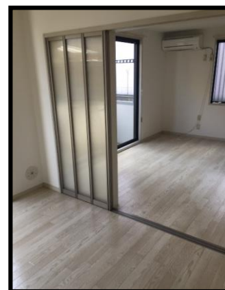
広めのリビングとしてもつかえるのが良いですね♪