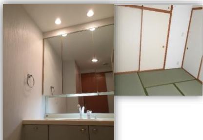
ゆとりの水まわり