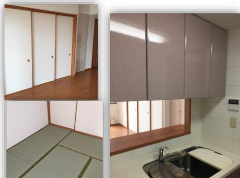
リビングを臨む カウンター付きキッチン